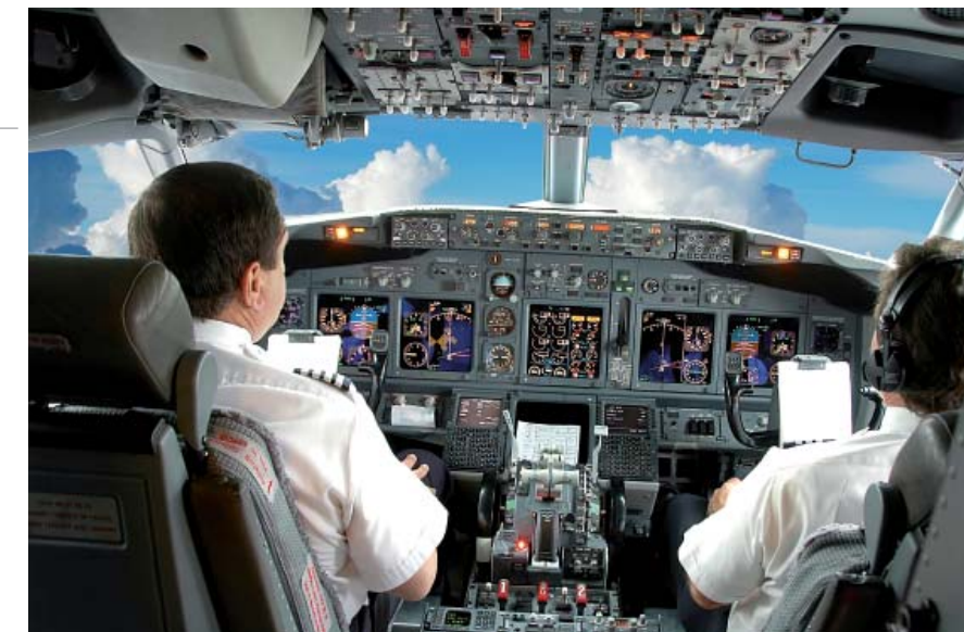
Institutionen funktionieren nur, wenn es Systemvertrauen gibt.

Vertrauen beruht auf der Kraft längerfristiger Perspektiven, ist jedoch seiner Natur nach kurzfristig aus-