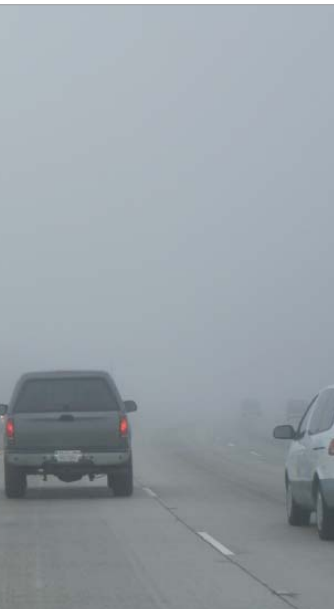
In der Unsicherheit des Nebels sind Vertrauenswürdigkeit und Verlässlichkeit der Schlüssel, um Krisensituationen zu meistern.