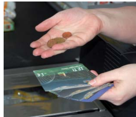
Talentgutscheine im Tauschkreis Vorarlberg: eine Ergänzung des Sozialsystems

Krisenhilfe, sondern entfalten auch in anderer Hinsicht sehr positive Eigenschaften: Sie fördern Strukturen der Nähe im Wirtschaftskreislauf ebenso wie in sozialer Hinsicht. Komplementärwährungen bewähren sich in der Sicherung der Nahversorgung mit Lebensmitteln, Energie und Betreuungsdiensten und stärken damit nach dem Subsidiaritätsprinzip die Eigenständigkeit von Regionen gleichermaßen wie die BürgerInnen-Selbsthilfe.