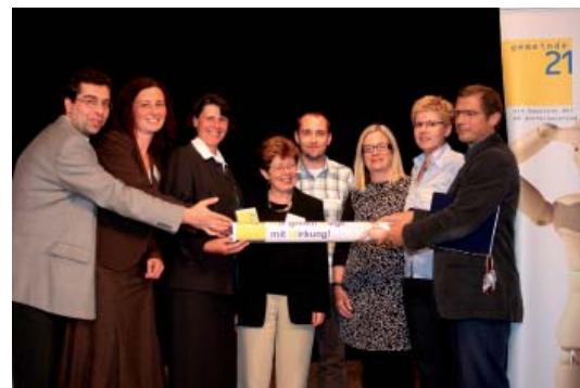
Feierliche Stafettenübergabe an Vorarlberg, das den nächsten Gipfel ausrichten wird.

„BürgerInnenbeteiligung live – wir wollen es wagen“ hieß das Motto des 5. Lokale Agenda 21-Gipfel im Mai in den Waldviertler Gemeinden Eichenbach und Schwarzenau. Der Einladung des Landes Niederösterreich und des Lebensministeriums als Veranstalter waren 280 TeilnehmerInnen aus ganz Österreich gefolgt. Das Programm reichte von einem groß angelegten Diskussionsforum, in dem 11 ReferentInnen etwa ihre Ansätze zu Ressourcenpolitik, Regionalentwicklung oder Migranten- und Jugendbeteiligung präsentierten, über Workshops,