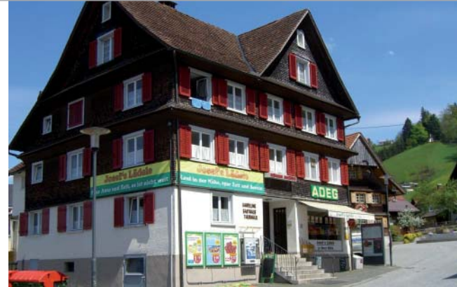
Der Dorfladen als Symbol für Gemeinschaft

Nahversorgung und Lebensqualität sind die Dauerbrenner, wenn es um die Zukunft der Dörfer und die Erhaltung der Lebensqualität als Grundlage für eine zukunftsfähige Entwicklung geht. Im Frühjahr 2008 reagierten mehrere kleine Gemeinden in Vorarlberg darauf mit der Gründung des Vereins „Dörfliche Lebensqualität und Nahversorgung“. Mit der Gründung traten 30 Gemeinden dieser Initiative bei, mittlerweile sind knapp die Hälfte der Vorarlberger Gemeinden Mitglied.