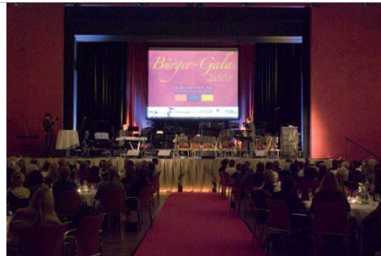
Bürgergala in Nürtingen: Die Stars sind Bürgerinnen und Bürger

Beteiligung wird von der Mehrzahl der BürgerInnen als größte Form der Anerkennung angesehen. Sie wollen einbezogen werden, beteiligt sein und dazugehören. In Nürtingen finden dazu regelmäßig nach einer großen und umfassenden Bürger-